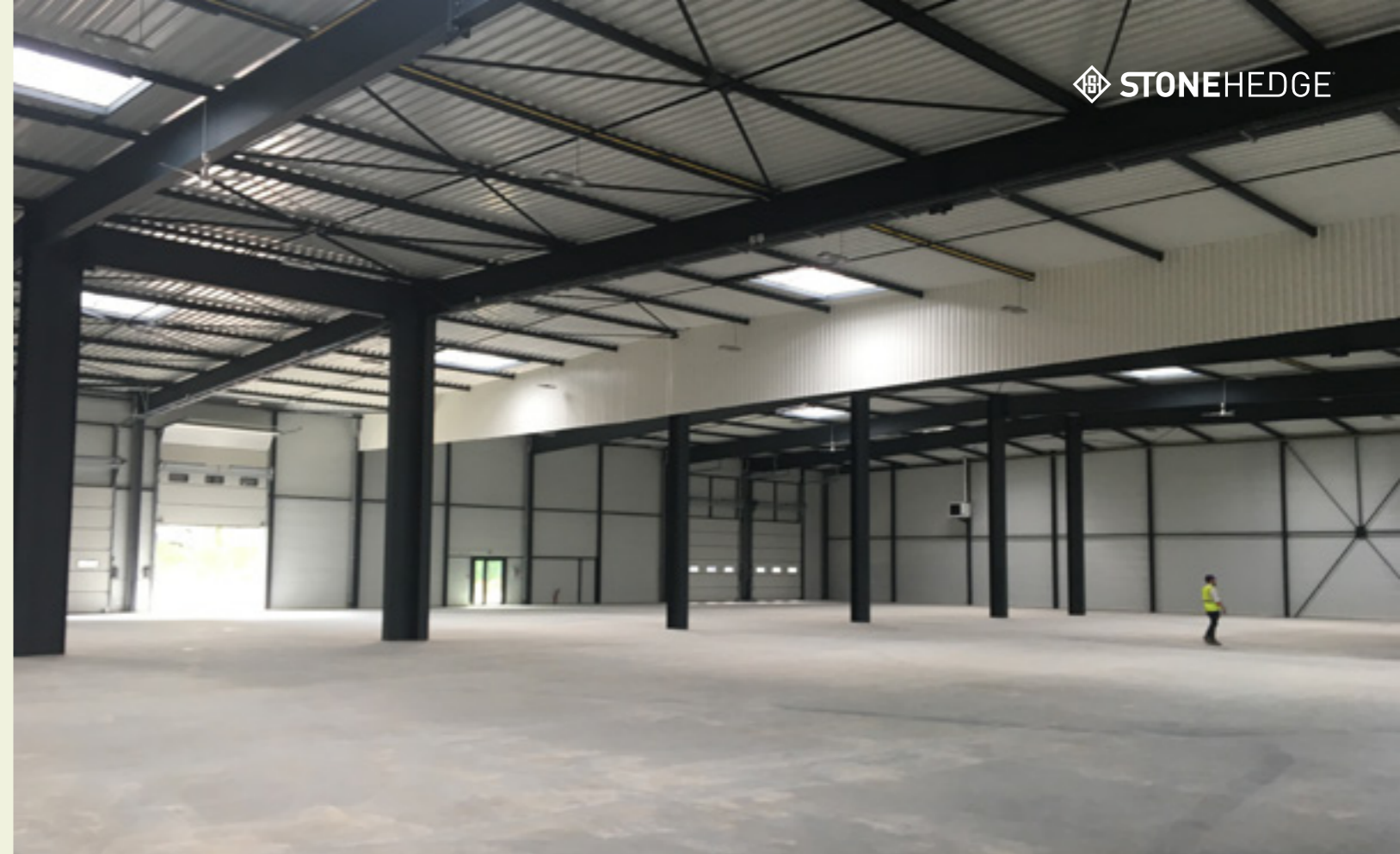
STONEHEDGE® MITRY-MORY - RDC Activités