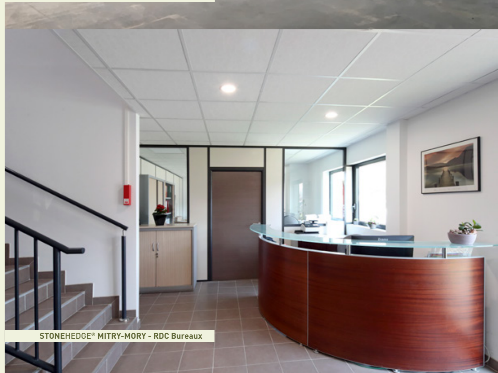
STONEHEDGE® MITRY-MORY - RDC Bureaux