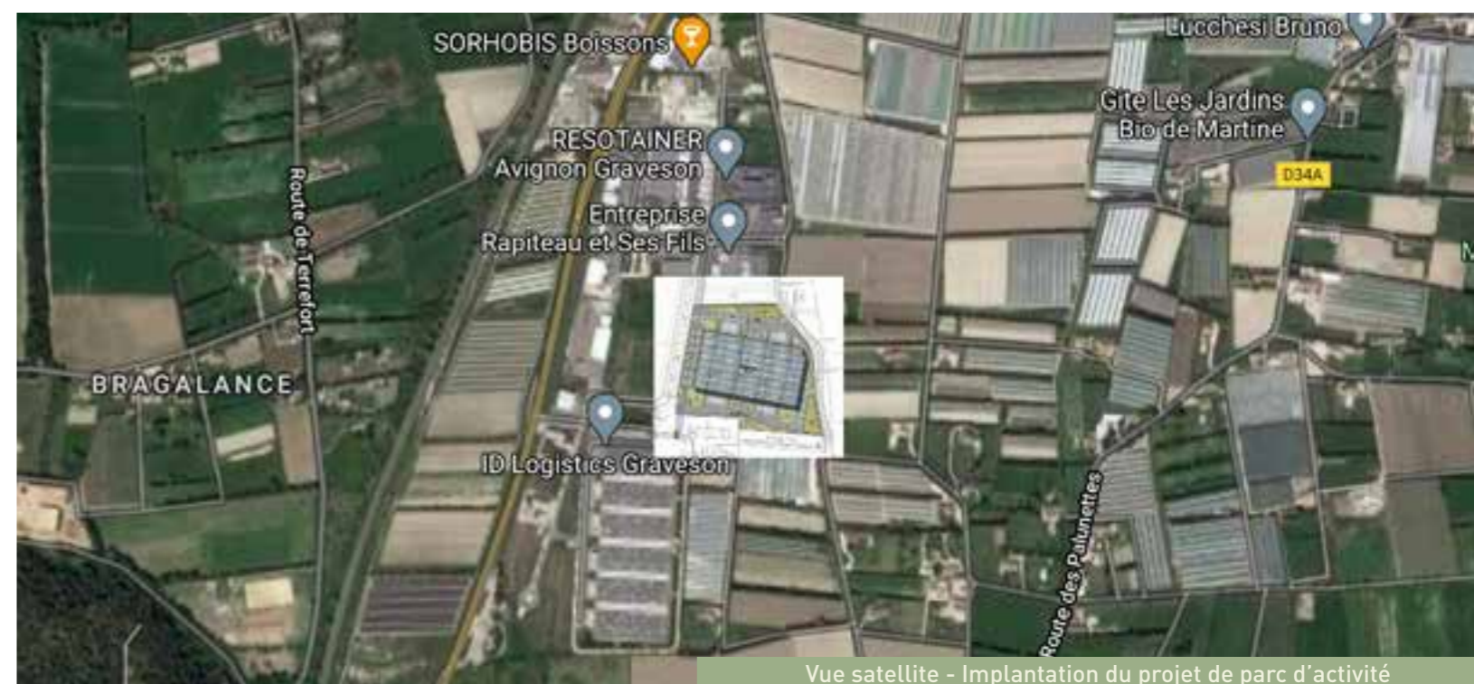
Vue satellite - Implantation du projet de parc d'activité