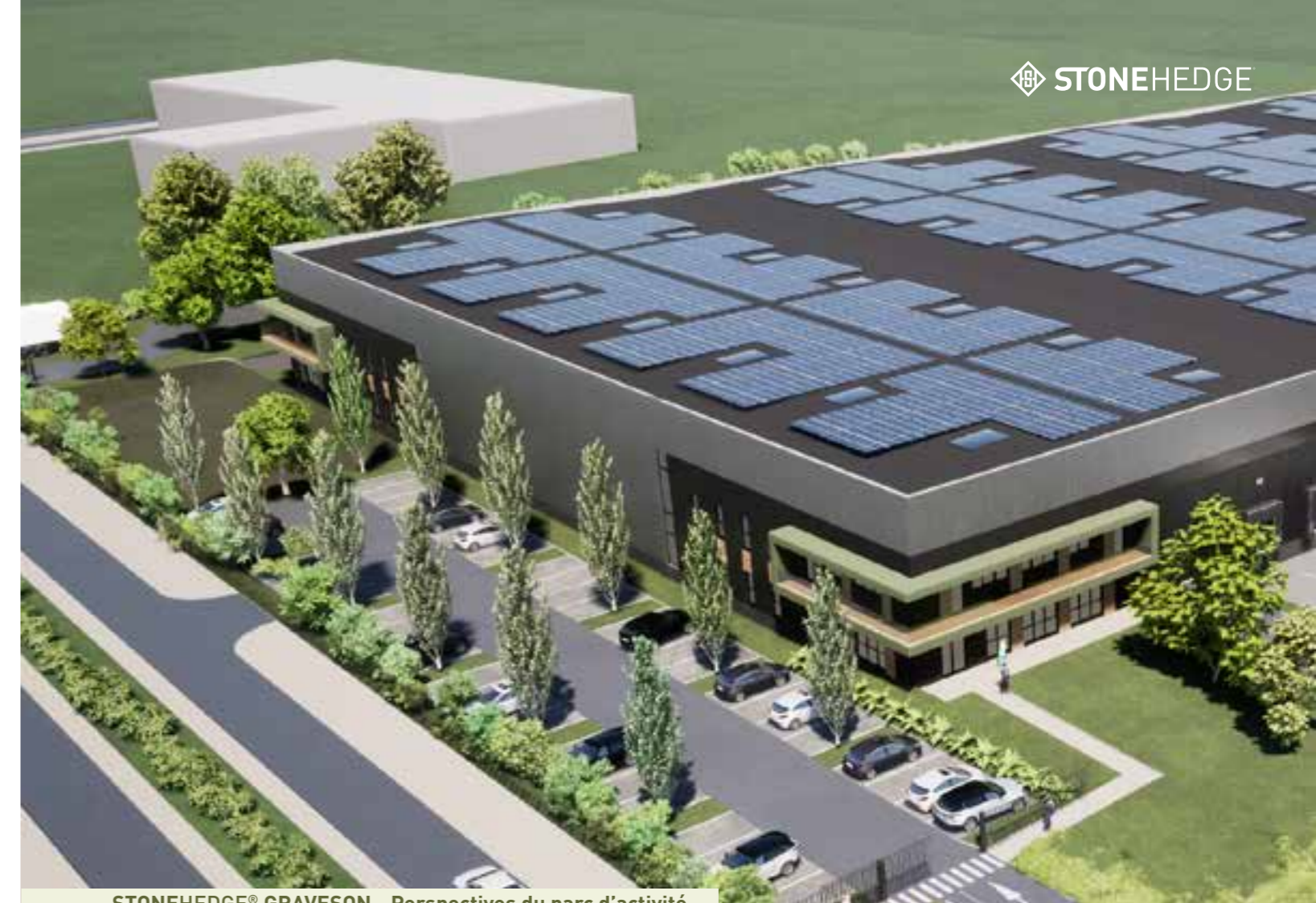
STONEHEDGE® GRAVESON - Perspectives du parc d'activité