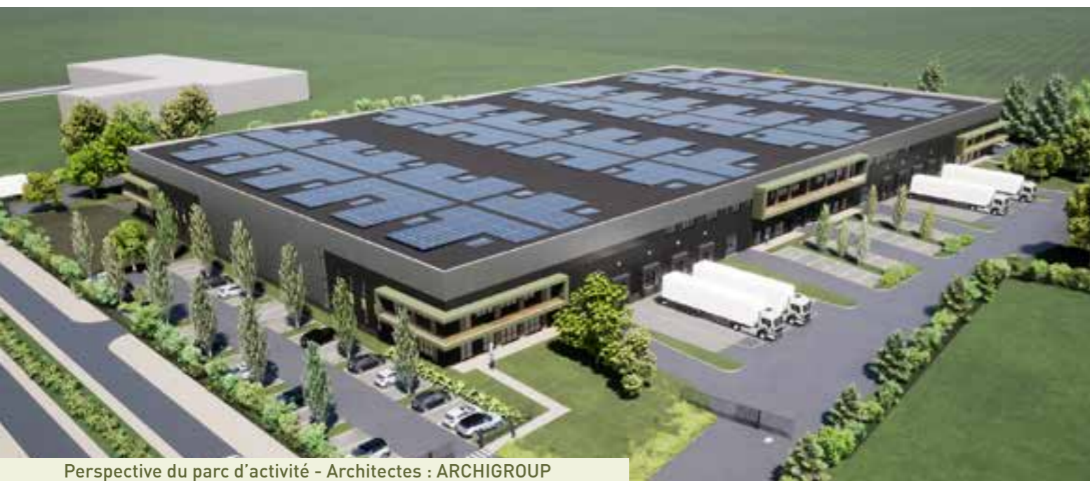
Perspective du parc d'activité - Architectes : ARCHIGROUP